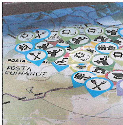
Ejemplo de mapas Físicos de trabajo