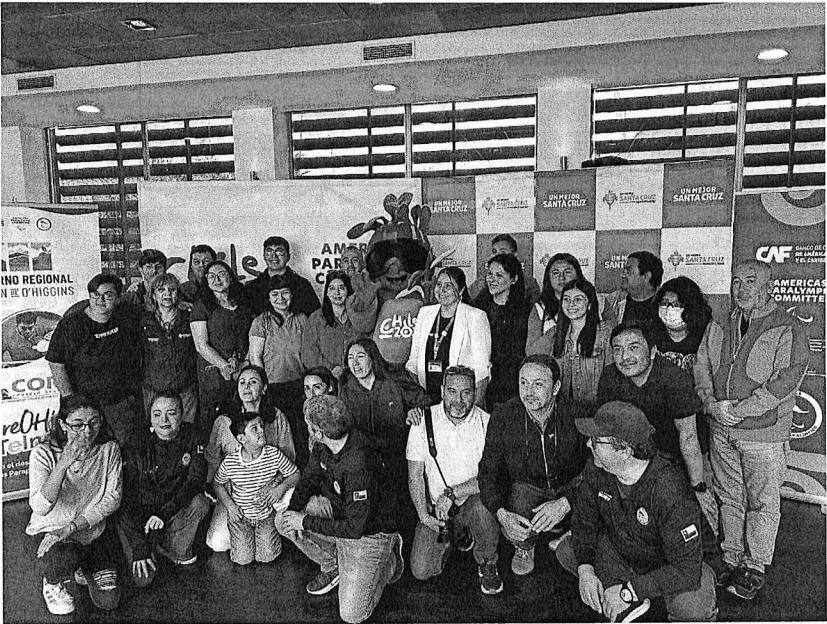
Capacitación Deporte Paralímpico, sábado 18 de octubre