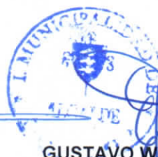
GUSTAVO WILLIAM AREVALO CORNEJO Alcalde