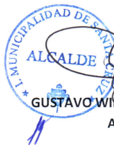
GUSTAVO WILLIAM AREVALO CORNEJO Alcalde