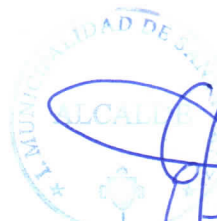
GUSTAVO WILLIAM ARÉVALO CORNEJO Alcalde