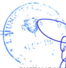
GUSTAVO WILLIAM AREVALO CORNEJO Alcalde