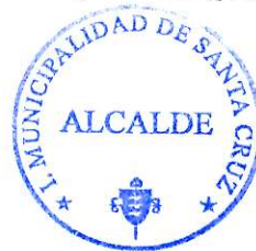
GUSTAVO WILLIAM AREVALO CORNEJO Alcalde

ANÓTESE, COMUNÍQUESE, PUBLÍQUESE Y ARCHÍVESE.