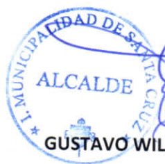
GUSTAVO WILLIAM ARÉVALO CORNEJO Alcalde