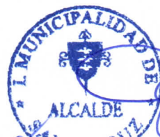
GUSTAVO WILLIAM AREVALO CORNEJO Alcalde