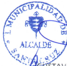
AGUSTAVO WILLIAM ARÉVALO CORNEJO Alcalde