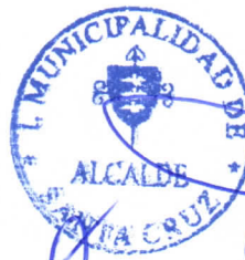
GUSTAVO WILLIAM ARÉVALO CORNEJO Alcalde