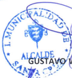
GUSTAVO WILLIAM AREVALO CORNEJO Alcalde