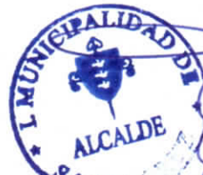
GUSTAVO WILLIAM AREVALO CORNEJO Alcalde