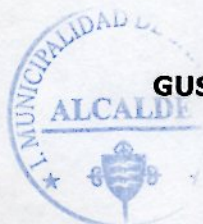
GUSTAVO WILLIAM AREVALO CORNEJO Alcalde