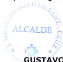
GUSTAVO WILLIAM AREVALO CORNEJO Alcalde