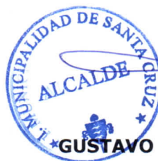
GUSTAVO WILLIAM AREVALO CORNEJO Alcalde