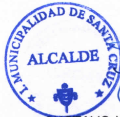
GUSTAVO WILLIAM AREVALO CORNEJO Alcalde