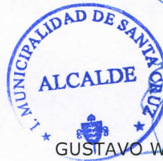
GUSTAVO WILLIAM ARÉVALO CORNEJO Alcalde