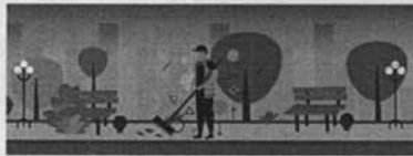
Resumen Costos Operacionales y Mantenimiento Alternativa B Senderos Hormigón y Maicillo