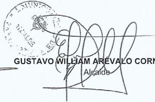
GUSTAVO WILLIAM ARÉVALO CORNEJO Alcalde