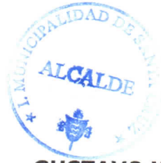
GUSTAVO WILLIAM AREVALO CORNEJO Alcalde