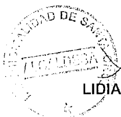
LIDIA ELIANA PIZARRO GAMBOA Alcaldesa