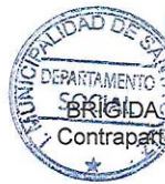
BRIGIDA GONZÁLEZ GUTIÉRREZ Contraparte Municipal Programa 4 a 7